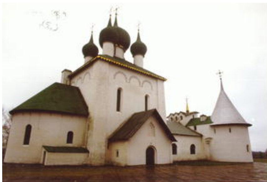
Храм прп.Сергия Радонежского на Куликовом поле, построенный на земле принадлежавшей Олсуфьеву Ю.А.